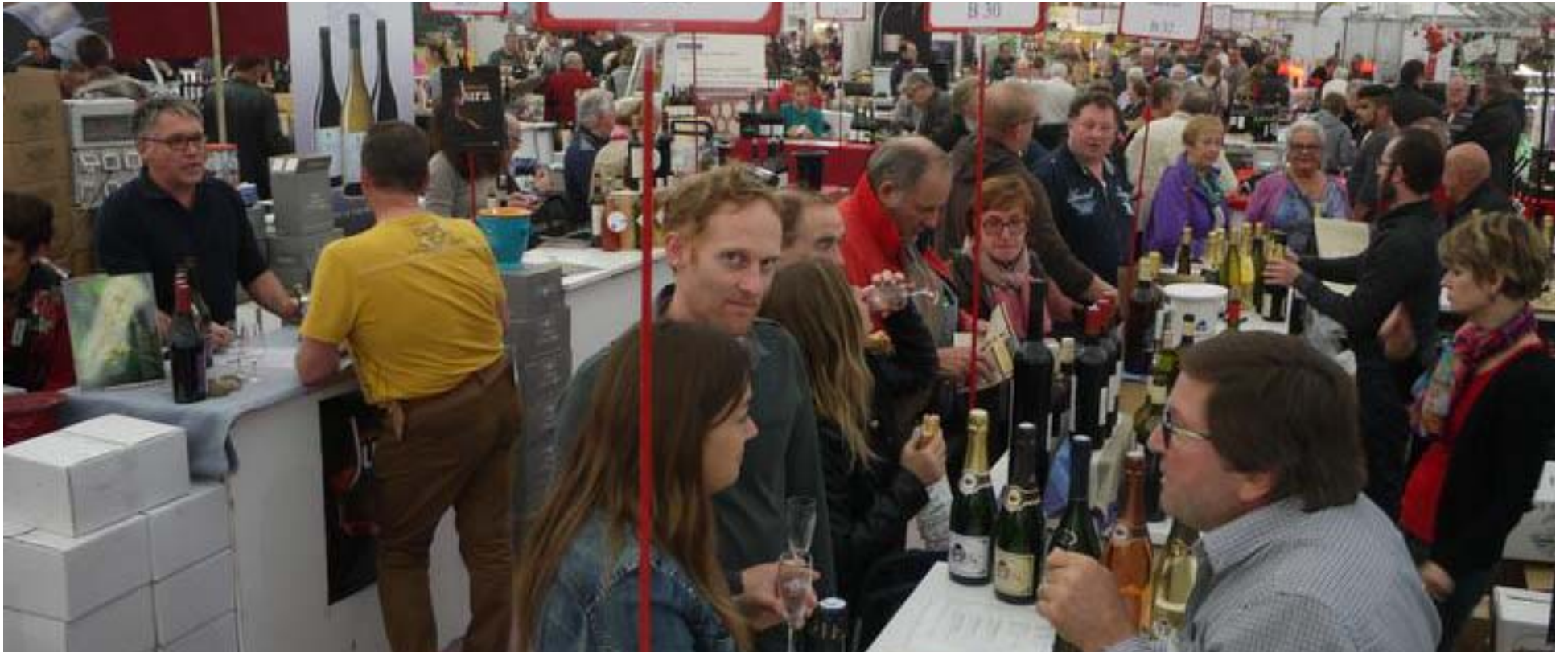
Dès la première journée de salon, les allées du chapiteau du parc de la Ramie ont accueilli la foule.

Tout était fin prêt vendredi matin pour accueillir les premiers clients du Salon des vins de terroir sous l'immense chapiteau planté au milieu du parc de la Ramie. Entre des vigneron et artisans ravis d'entrer enfin dans le vif du sujet et des clients en quête d'émotions douces et fortes, il n'y a pas eu de round d'observation !