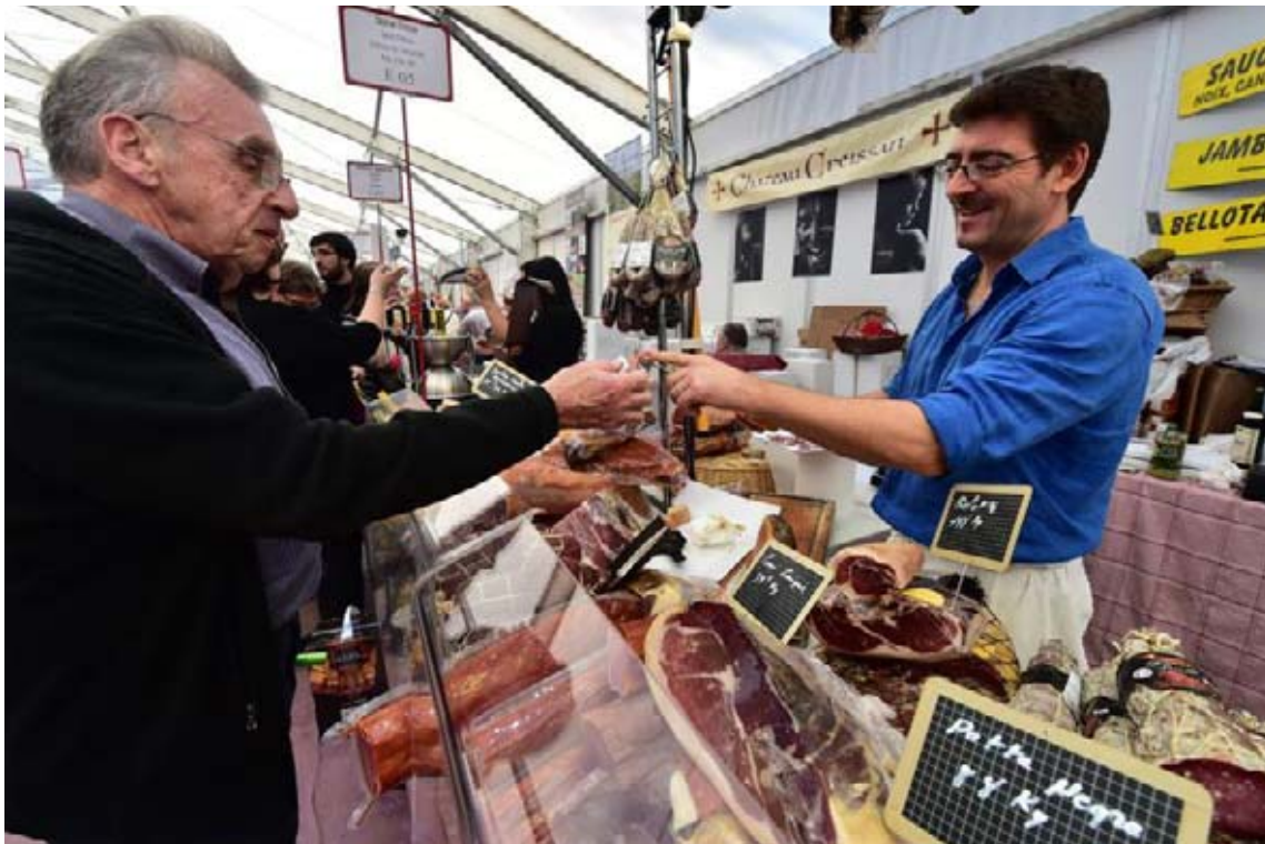
Echanges entre un charcutier et un visiteur en pleine dégustation.

Le Salon des vins de terroir et des produits régionaux est bien installé depuis deux jours et l'ambiance du week-end est au beau fixe avec le soleil qui s'est ajouté en prime. Près de 300 exposants sont au parc de la Ramie. Essentiellement du vin mais aussi du fromage, de la charcuterie, du miel, etc.