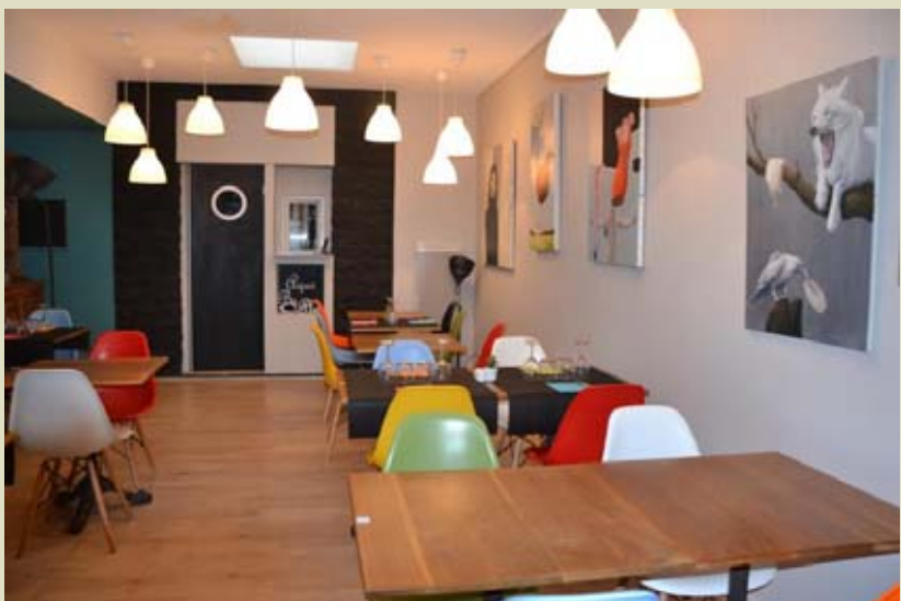
Ce nouveau restaurant propose une carte des mets composée de tapas mais aussi de plats du Sud-Ouest revisités.

LILLE. Ouvert depuis mi-octobre, ce restaurant aux accents occitans propose différentes formules midi et soir. Une carte des mets composée de tapas mais aussi de « plats du Sud-Ouest revisités », le tout accompagné de légumes du soleil. Situé à deux pas du palais des Beaux-Arts, l'établissement accueille de nouvelles expos toutes les six semaines entre ses murs. Et change tout aussi fréquemment ses plats. Côté bouteilles, les vins proviennent également des vignes du Sud-Ouest. Les formules démarrent à 15,50 € le midi et 21 € le soir. ■ Au, 43 rue Nicolas-Leblanc. Ouvert du lundi au samedi.