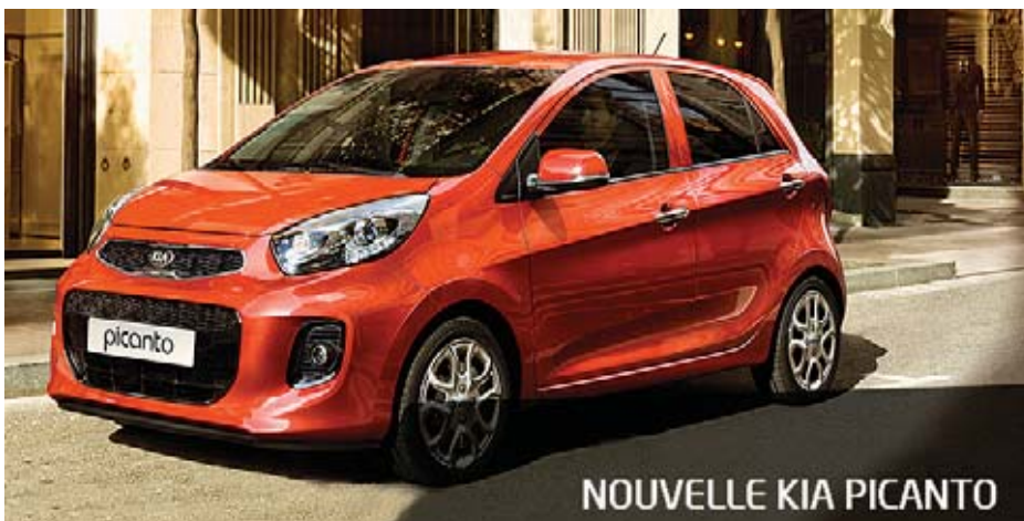
NOUVELLE KIA PICANTO

autres et doit parfois se montrer ferme lorsqu'un habitué souhaite passer outre les règles communes. Des habitués, on en trouve d'ailleurs beaucoup derrière les différents stands (comme on en trouvera beaucoup dans les allées), preuve s'il en était besoin que les vendeurs comme les consommateurs y trouvent leur compte. D'ailleurs, l'essentiel est bien que ce matin, il ne restera plus trace de ce grand branle-bas de combat préparatoire, et que chacun des trois cents exposants sera prêt à accueillir de la meilleure des façons la foule des inconditionnels du rendez-vous seclinois. ■