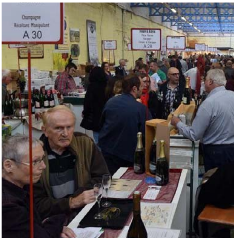
Le salon des vins de Seclin est organisé deux fois par an. Si vous ratez celui-là, il faudra attendre six mois.

hommes et des femmes qui fabriquent vins, charcuterie ou fromages. Pour cette 38 e édition du salon, ils seront encore près de trois cents vigneron et artisans à vous tendre les bras à vous inviter à une révolution de palais. Une représentation nationale du savoir-faire viticole, au plus près