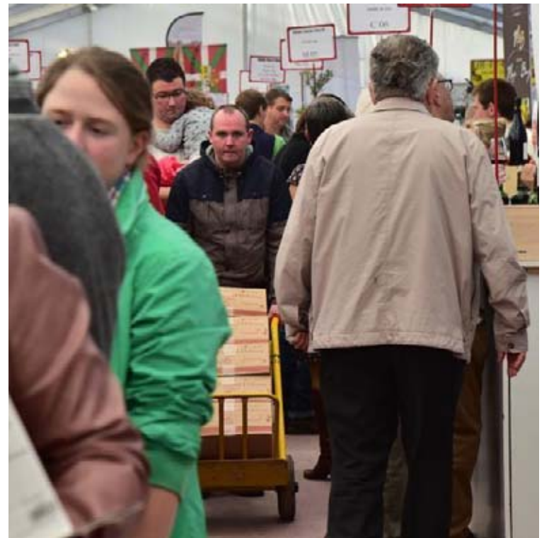
Le porteur qui se fraie un chemin pour la livraison du vin. Pensez aux petits chariots à roulettes, car le lieu est vaste, le parking aussi...