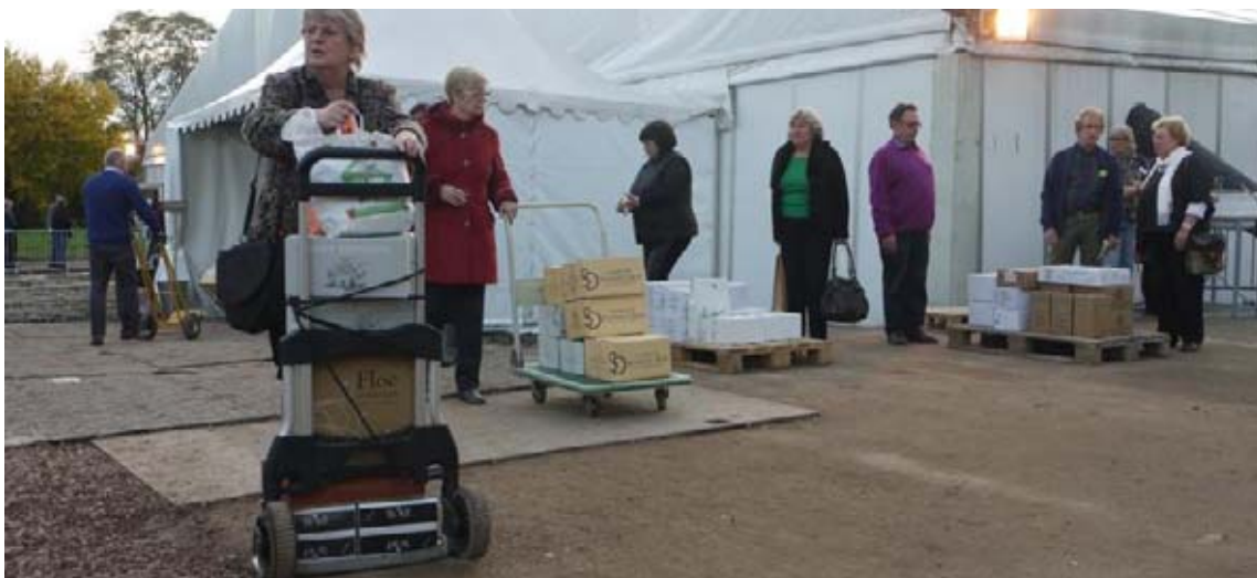
Ce n'est pas le métro aux heures de pointe, mais l'attente sur la zone de chargement à la sortie du chapiteau...

Ce dimanche, de 10 h à 20 h ; lundi de 10 h à 18 h. Entrée sur invitation (dans La Voix du Nord et sur le site www.vins-de-terroir.com ), un verre de dégustation à vendre (2 euros) à l'entrée.